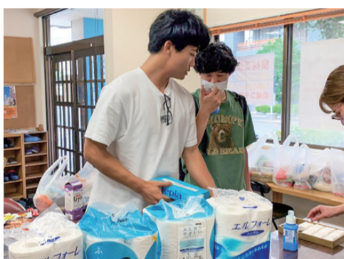
必要な食材や日用品を選ぶ学生たち

コロナ禍が始まって以来、おかやま医系学生サポーターセンターではバイトなどがなくなり生活に苦しむ医系学生が