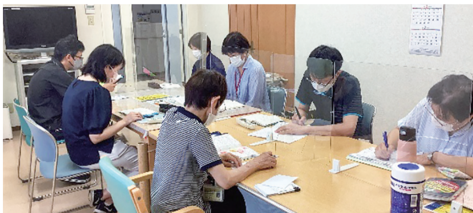
1人で抱え込まないようチームで解決

「在宅で生活する」と言っても利用者さん一人一人望む暮らしがあり、大切にしていることも異なります。その方の望む生活を続けられるように丁寧にお話を伺い、多くのサービスや地域資源の中からその方に最も良いと思われるケアプランを作成することが私たちのメインです。またケアプラン作成だけに留まらず、各種サービスや地域資源を繋ぐネットワークづくりや、ご自身で声を上げることで困難な方の代弁者としての役割も意識して活動するよう心がけています。