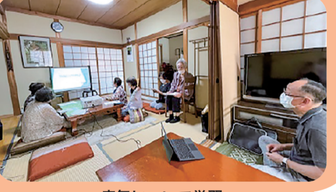
病気について学習